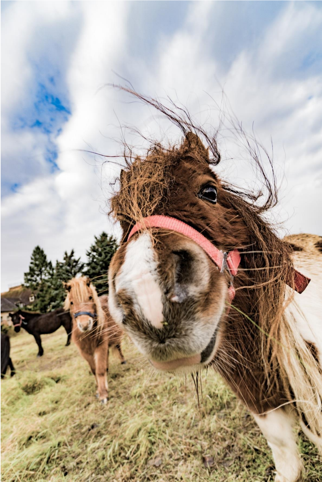
Ponys in Naumburg (Saale)